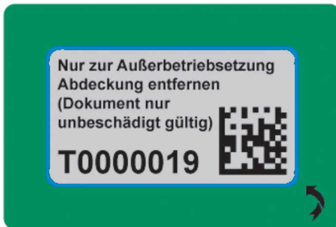
Abbildung zur Markierung mit Sicherheitscode nach Sichtbarmachung: