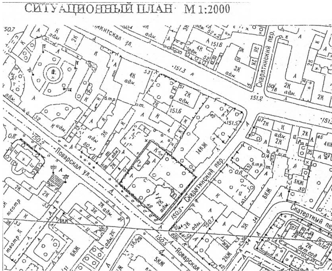
План земельного участка по документации МосгорБТИ.

Anlage 1 zum Abkommen zwischen der Regierung der Bundesrepublik Deutschland und der Regierung der Russischen Föderation über die Bedingungen für die Überlassung von Liegenschaften in Frankfurt am Main, München und Moskau für die Zwecke der Botschaft der Bundesrepublik Deutschland in der Russischen Föderation und der Generalkonsulate der Russischen Föderation in der Bundesrepublik Deutschland