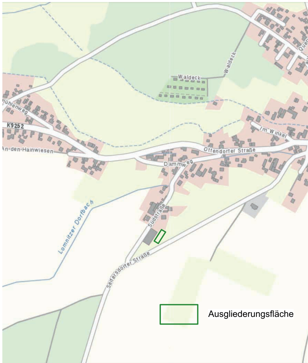
Übersichtskarte M. 1 : 5000